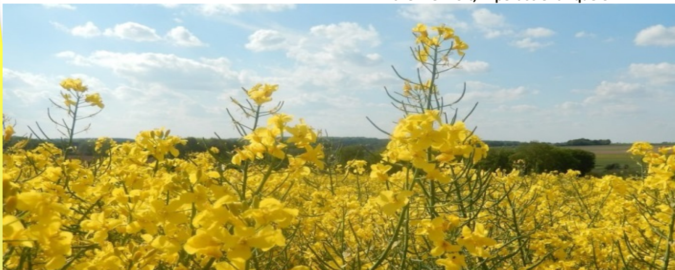
Photo 1 : Colza en fleurs avec siliques déjà bien formées sur fond de changement de temps.